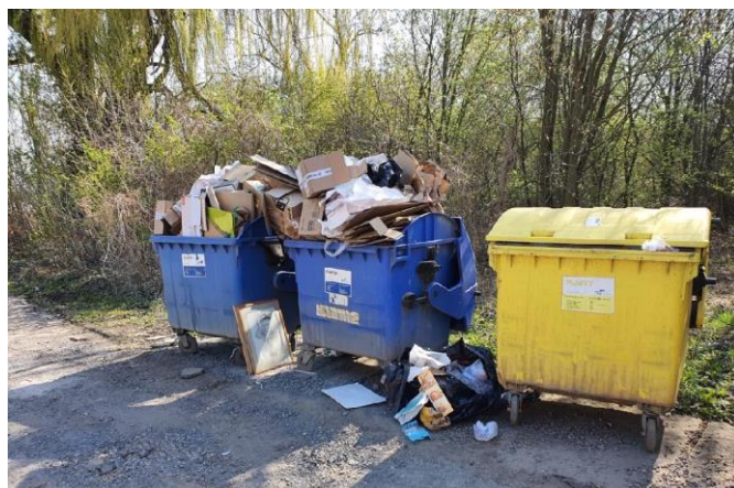
Obr. č. 2: Tento stav kontejnerů nelze ani nazvat tříděním odpadu – směsný odpad odložený mimo sběrné nádoby, nerozložené velké krabice plné igelitu,...