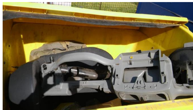
Obr. č. 1: Sedačka do auta a palubovka v kontejneru pro plasty v ulici V Kateřinkách (obojí patří do sběrného dvoru nebo velkoobjemového kontejneru)

Tyto náklady jsou mnohdy zbytečně navyšovány kvůli likvidaci nevhodně odloženého či vytříděného odpadu. Kontejnery se pravidelně stávají odkladištěm odpadu, který tam nepatří buď vůbec nebo je odložen nevhodně (např. velké nerozložené kartonové krabice apod.). V těchto dnech (a nejen v nich) je obzvláště důležité, aby byla pravidla správného třídění dodržována a obsluha svozové firmy či pracovník údržby obce nemusel přijít s odpadem do přímého kontaktu. V tabulce níže je přehled stanovišť a frekvence svozů.