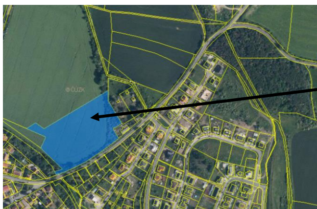
Pozemek pro budoucí výstavbu spolkové školy ve městě Odolena Voda